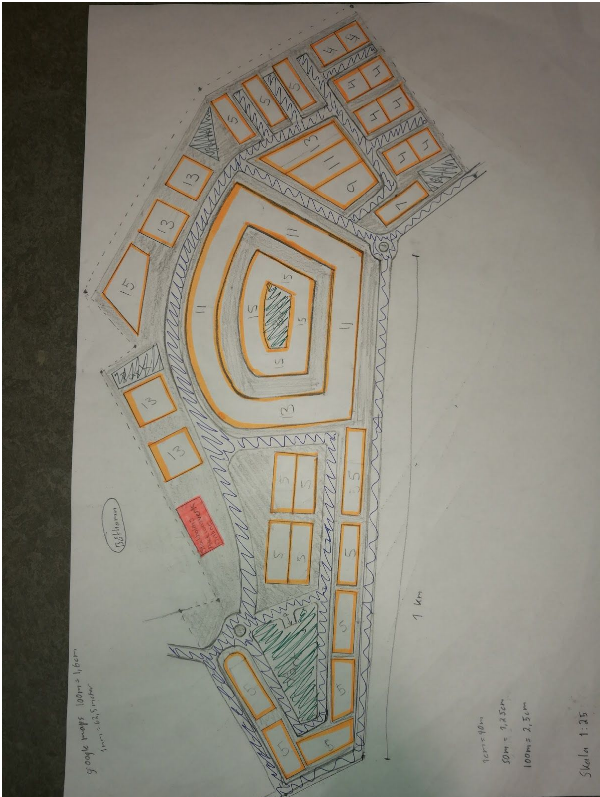
Stadsplanering av Loudden uppgift Arkitektur Blått: väggar 30 km/h Grönt: Parkområden Orange med siffror: Byggnader med våningsplan